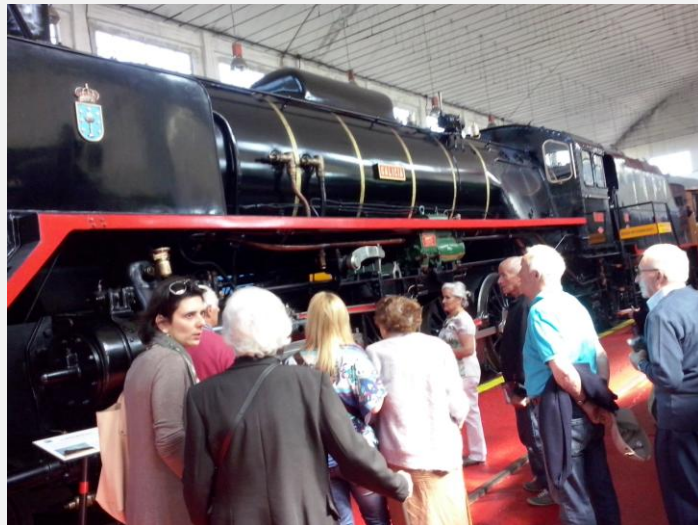
Visita al Museo del Ferrocarril (Monforte)