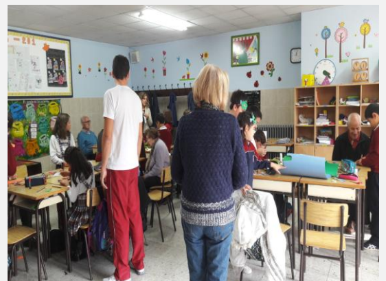
Taller Intergeneracional en Colegio Torre de Lemos

El carácter evocador de las situaciones del pasado facilita que las personas con Alzheimer y otras demencias revivan momentos de la etapa anterior a la enfermedad estimulando así su memoria y manteniendo el mayor tiempo posible a relación con la cultura. Las personas beneficiarias estuvieron acompañadas y supervisadas por los trabajadores y voluntarios de AFAMON.