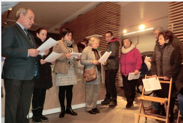
Lectura del Manifiesto por el Alcalde y miembros de las Asociaciones

El día 3 de diciembre es el día Internacional de las personas con discapacidad. Por primera vez este año se realizó un acto conjunto en el que participaron diversas asociaciones del ámbito de la discapacidad y dependencia del municipio de Monforte de Lemos. Para promover el trabajo de las diferentes entidades sociales y los derechos de las personas con capacidades diferentes se elaboró un mural reivindicativo y se procedió a la lectura de un manifiesto. Los actos tuvieron lugar en la sala de exposiciones de la Plaza de Abastos del Ayuntamiento de Monforte.