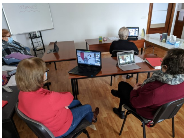
Visita inmersiva al Pazo de Tor

2.Pazo de Tor. Se realizaron dos visitas virtuales los días 27 de noviembre y 2 diciembre a través de videoconferencia donde nuestras personas usuarias pudieron acceder por medio de tablets y ordenadores portátiles a una visita guiada por las principales instalaciones de los Pazo de Tor de Monforte.