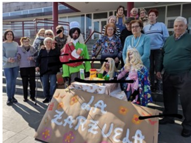
Representación del día del Compadre

1.El Carnaval : Se realizaron dos talleres de disfraces durante la semana del Carnaval de 2019. Los usuarios realizaron sus propios trajes de disfraz con la ayuda de personal técnico y voluntario de AFAMON. También colaboraron en el diseño de la Comadre y del Compadre, presentados en el concurso del Ayuntamiento, recibiendo un premio en la categoría Individual.